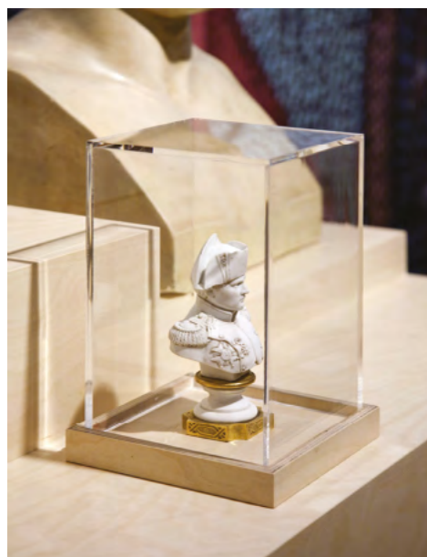
Capot Qube sur plateau

Toutes autres dimensions : NOUS CONSULTER.