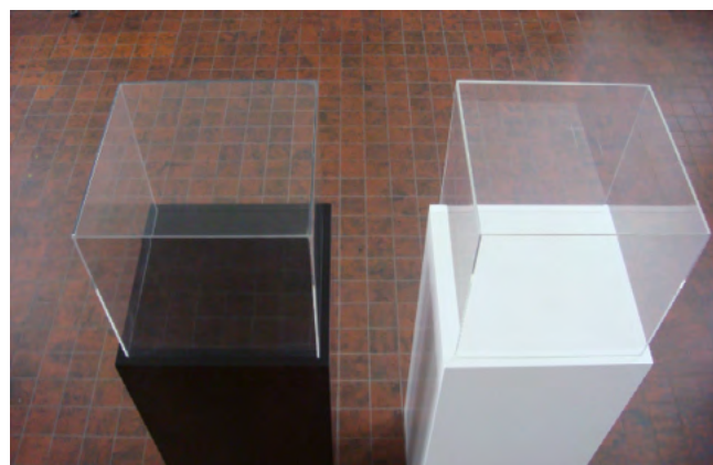
Capot Qube utilisé en vitrine cloche